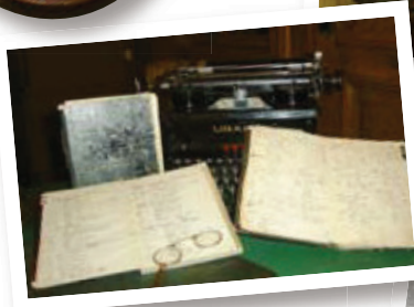
Originale Rezepturen aus dem 19. Jahrhundert

Die Alt Wiener Destilliererei ist die einzige historische österreichische Absinth-Destilliererei (seit dem 19. Jhdt) und wird von der Familie Fischer bereits in der 5. Generationen geführt.